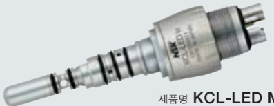
제품명 KCL-LED M 코드번호 P1005603 • KaVo® MULTiflex® LUX용 커플링(수량조절 가능)