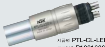
제품명 PTL-CL-LED M 코드번호 P1001606 • NSK용 커플링